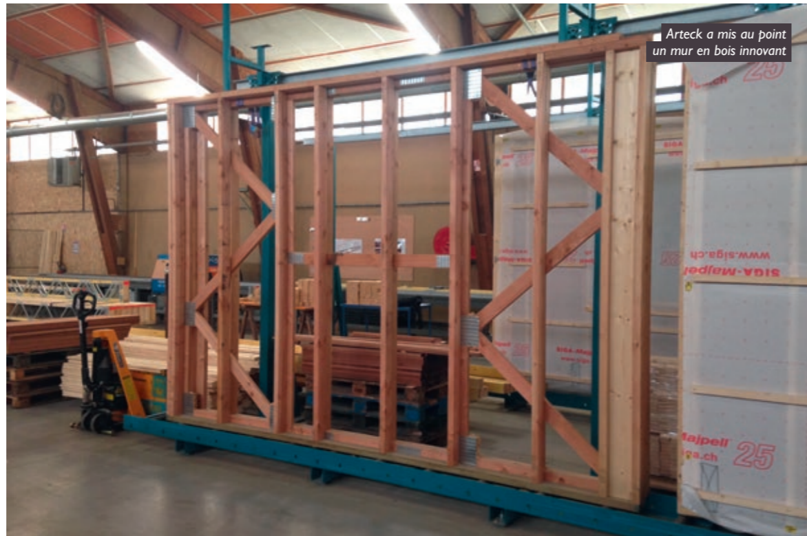
Arteck a mis au point un mur en bois innovant

Les différentes étapes de développement de la start-up, liées à l'assurance, à la certification et à la commercialisation, sont loin d'avoir découragé les membres d'Arteck, bien au contraire. D'autant plus qu'avec sa propre usine, située dans le département de la Haute-Marne, la