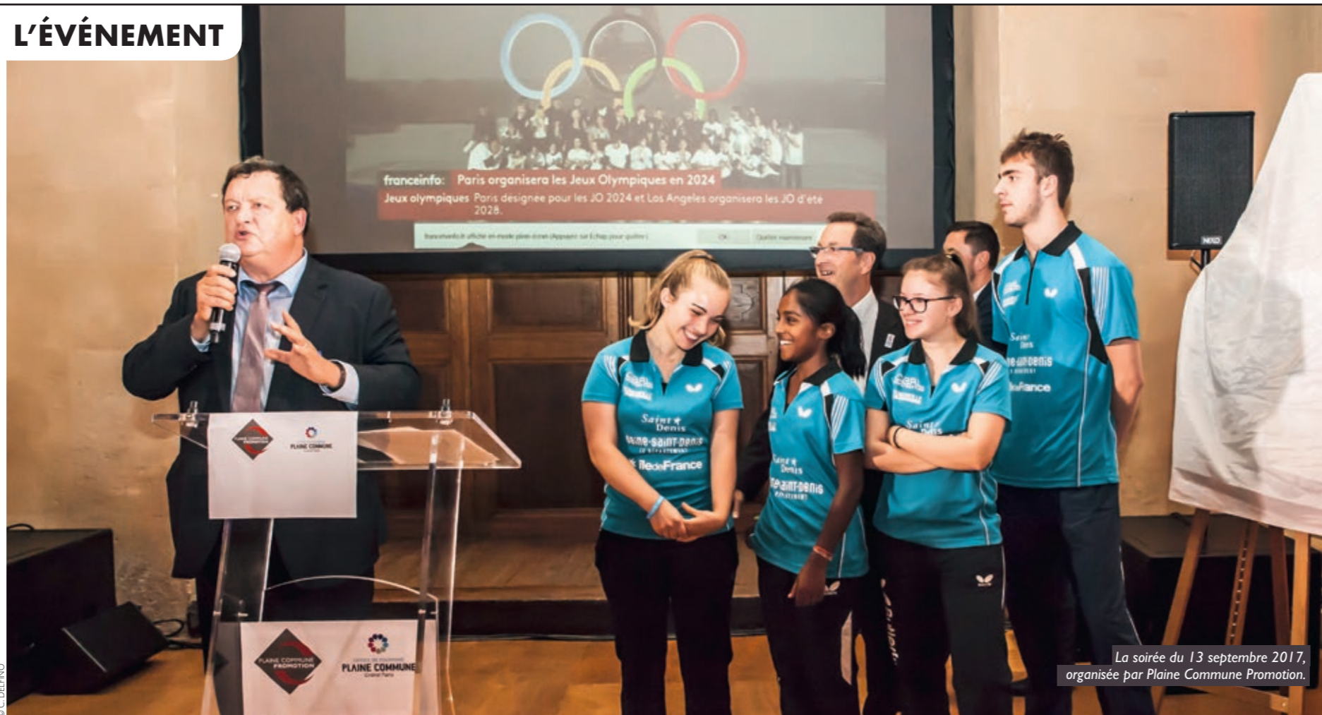
La soirée du 13 septembre 2017, organisée par Plaine Commune Promotion.