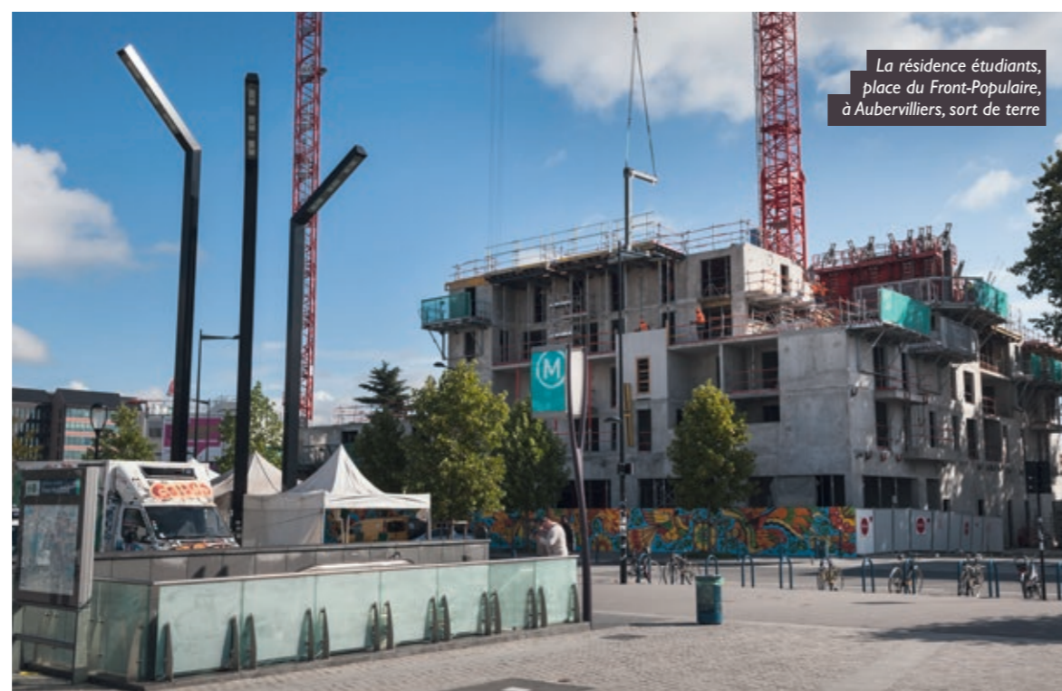
La résidence étudiants, place du Front-Populaire, à Aubervilliers, sort de terre

Sans interlocuteur unique, il est difficile à cette échelle de coordonner l'ensemble des chantiers. En effet, on distingue sur le territoire, au cœur de ces travaux, aussi bien des aménageurs, Séquano et Plaine Commune Développement, que des établissements publics tels que le campus Condorcet et le groupement Sérénacité à qui l'Etat a confié la conception et la construction de 50 000 m 2 de