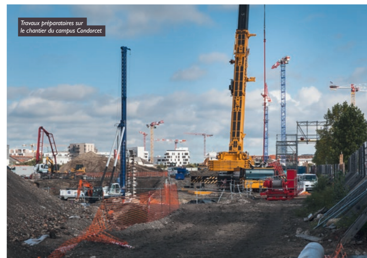
Travaux préparatoires sur le chantier du campus Condorcet

Parmi les autres réponses à apporter, il faut compter avec celle favorisant le métabolisme urbain qui conjugue à la fois la volonté de réutilisation de matériaux sur site,