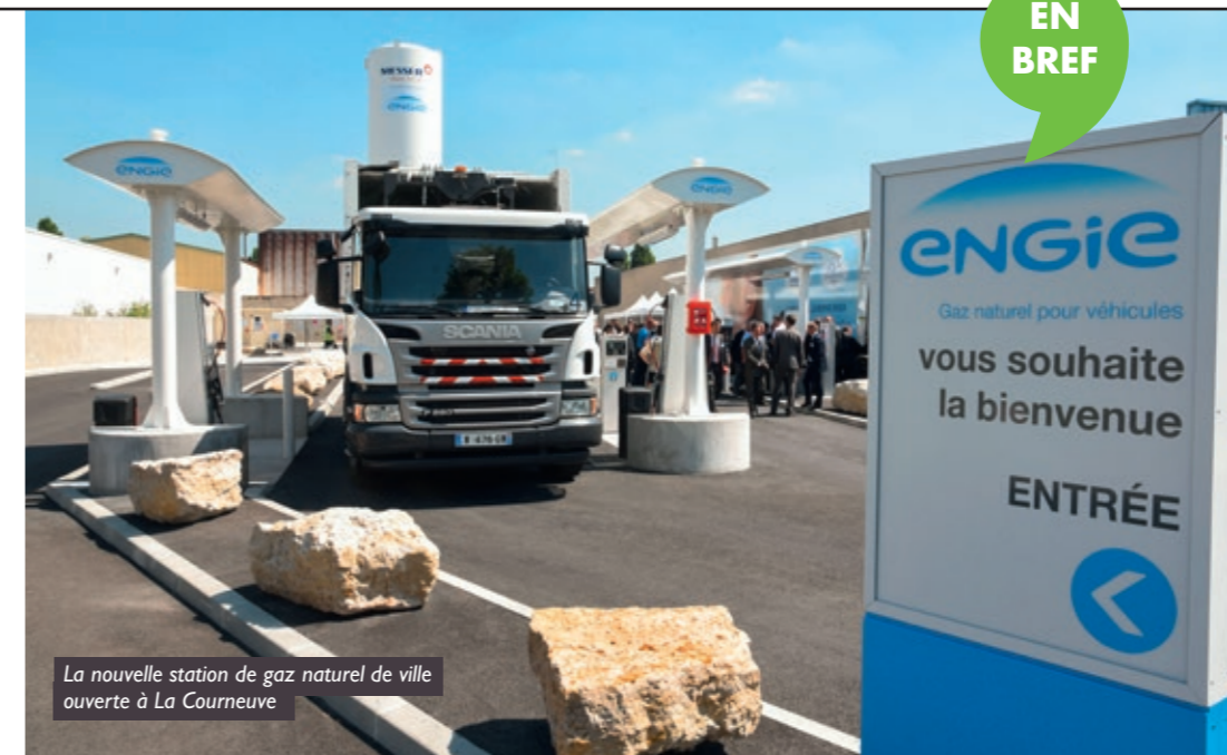
La nouvelle station de gaz naturel de ville ouverte à La Courneuve

Finis le temps où il fallait attendre quarante-cinq minutes pour relier Épinay au Bourget. Avec la mise en service du Tram 11 Express, le 1 er juillet dernier, il faut désormais trois fois moins de temps aux 60 000 voyageurs de ce tram-train pour parcourir les 11 km de ligne. Reste que beaucoup espèrent déjà son prolongement dans les années à venir : à l'ouest jusqu'à Sartrouville, et à l'est jusqu'à Noisy-le-Sec. Prévu de longue date et même déclaré d'utilité publique dès 2008, le tracé sur 28 km supplémentaires permettrait d'attirer encore davantage de voyageurs, tout en désengorgeant l'A86 saturée. Mais les travaux n'ont toujours pas commencé.