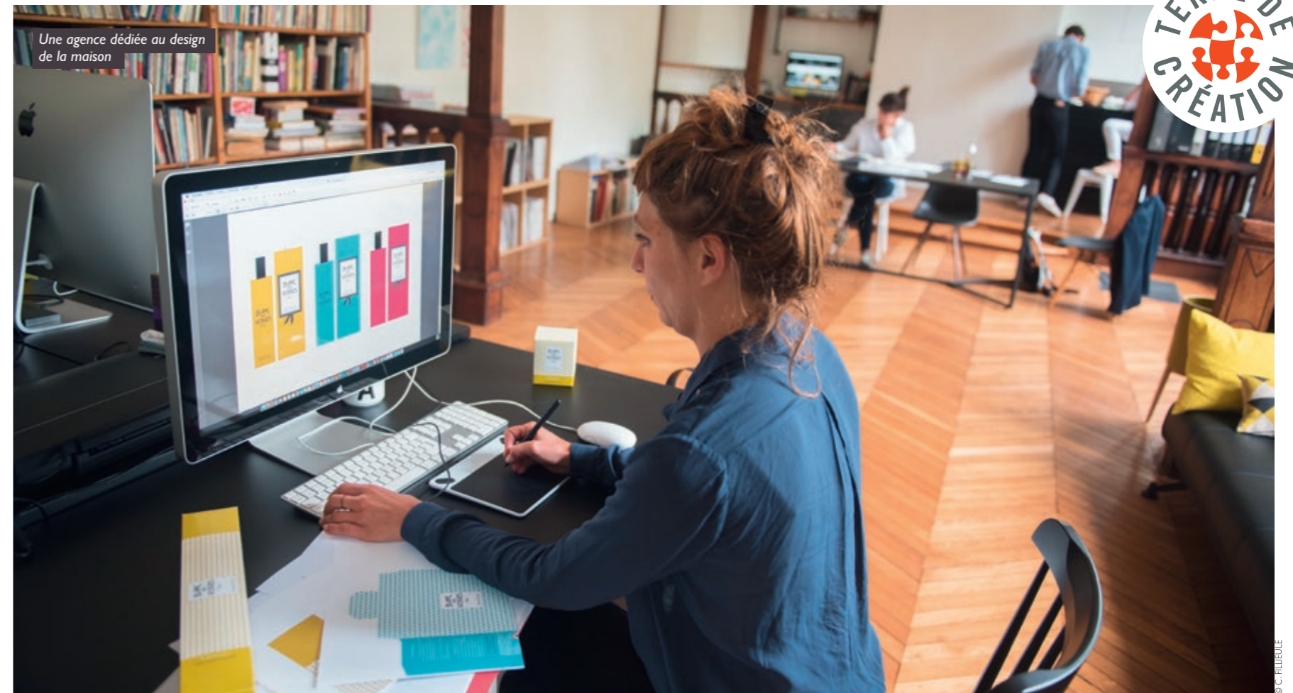
Une agence dédiée au design de la maison