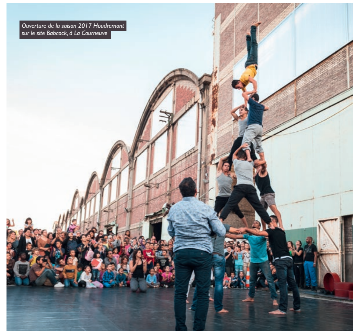
Ouverture de la saison 2017 Houdremont sur le site Babcock, à La Courneuve