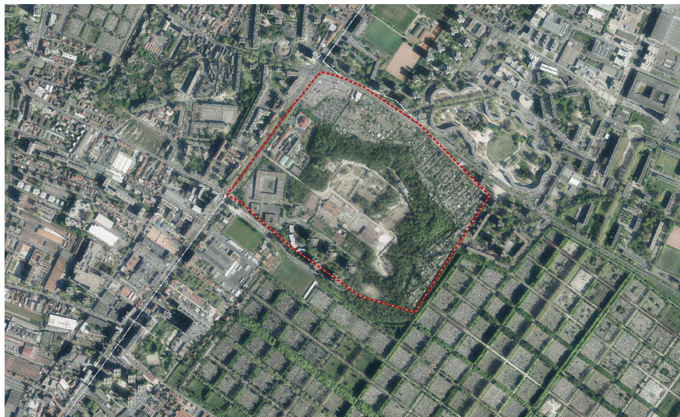
Fort d'Aubervilliers, vue satellite et périmètre de l'OAP