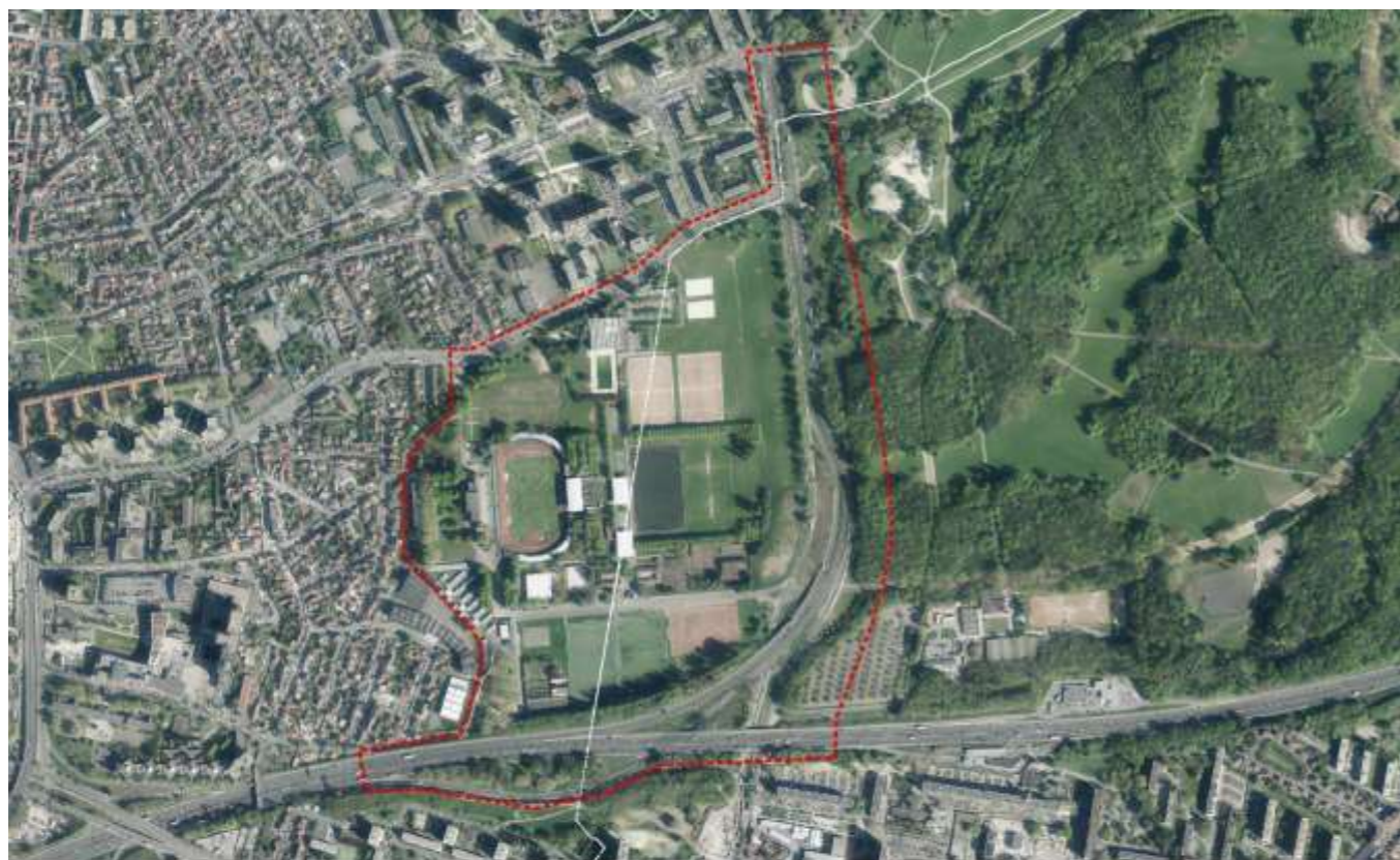
Marville, vue satellite et périmètre de l'OAP